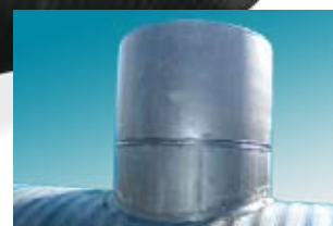
PE verhoging, uitw. Ø 630 mm