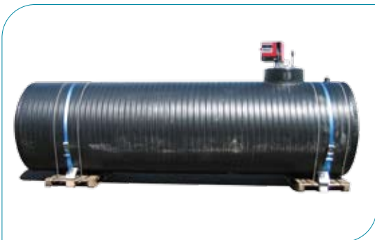
Bovengrondse IQ Tankstation diesel + pomp

1500 tot 120.000 l → boven -of ondergronds met pomp