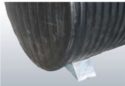
Steun (optie WZB)