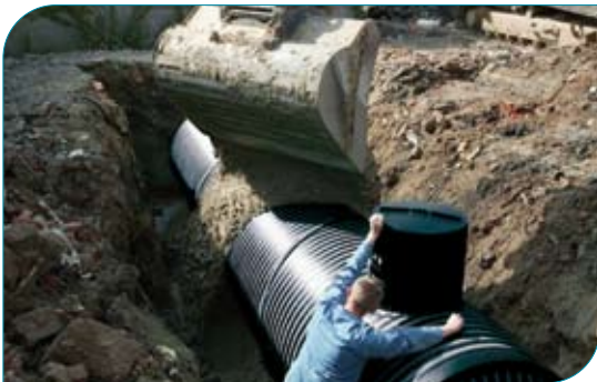
Ondergrondse IQ tankstation