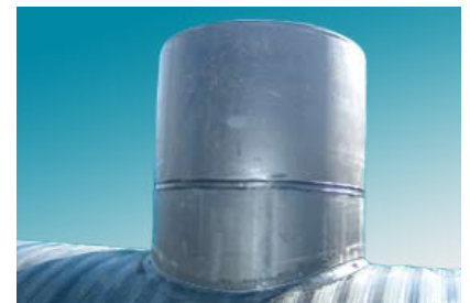
Verhoging in PE, uitw. Ø 630 mm (optie WZO)