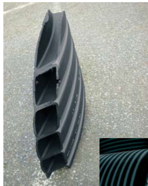
Dubbele wand van een IQ Tank